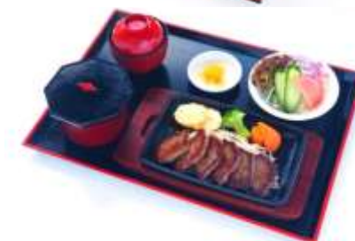
松阪牛カットステーキ